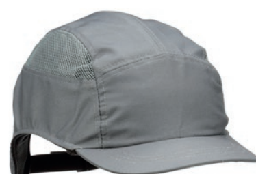
Casquette antiheurt 3M™ First Base™ 3 Extra

Casquette bicolore en tissu microfibre avec passepoil rétro-réfléchissant et coque flexible.