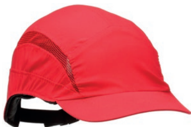
Casquette antiheurt 3M™ First Base™ 3 Classic

Casquette légère avec tissu microfibre et coque flexible.