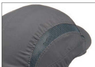
Ouvertures de ventilation larges