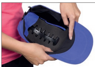
Bandeau en tissu maille

L'option « coque rigide » offre une protection accrue