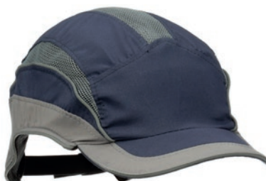
Casquette antiheurt 3M™ First Base™ 3 Elite

Casquette légère avec tissu microfibre et coque flexible.