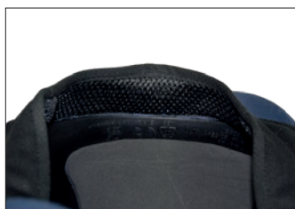
Bandeau avec espaceur