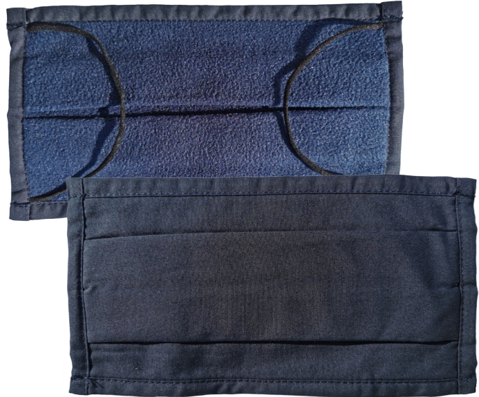
Face extérieure (Polycoton)