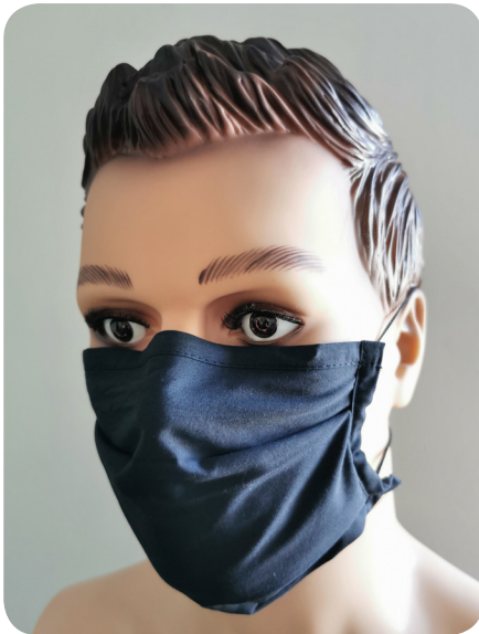
Face intérieure (Micropolaire)