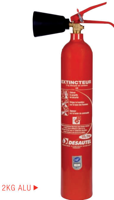
2KG ALU ▶

Il est certifié NF-EN 3 et fait partie des plus performants de sa catégorie.