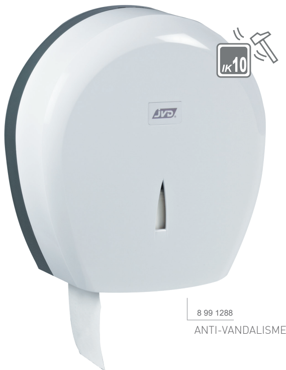
8 99 1288 ANTI-VANDALISME