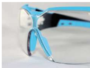
x-tended eyeshield couverture parfaite