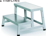
2 marches XL