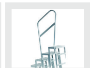
MAIN COURANTE 1) 453712