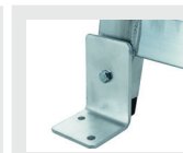
KIT FIXATION AU SOL 453711