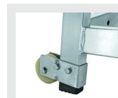
KIT ROUES 453710