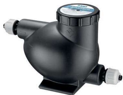
BWT SoluTECH Condensats Sol

» 3 modèles selon puissance (< 35 kW - < 350 kW)