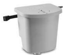
BWT SoluTECH Condensats 0-35 kW