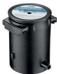
BWT SoluTECH Condensats +