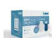
AQA CLEAN & PROTECT