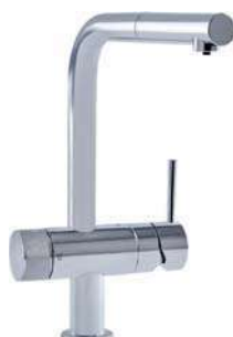
VERSION LOFT (avec mousseur extractible)