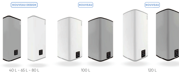
40 L - 65 L - 80 L