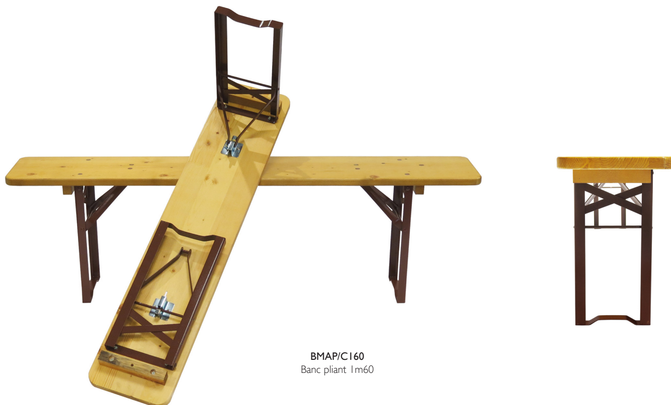
BMAP/C160 Banc pliant 1m60