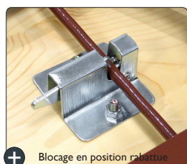
+ Blocage en position rabattue