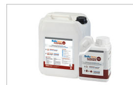
SoluTECH PLANCHERS CHAUFFANTS