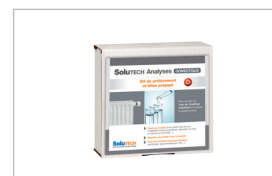
SoluTECH ANALYSES DOMESTIQUE