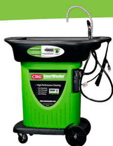
SW-23 Nettoyeur mobile de pièces/frein