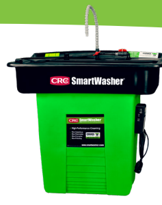
SW-28 Nettoyeur de pièces SuperSink