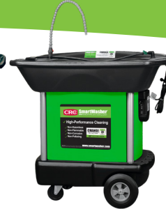
SW-37 Nettoyeur mobile de pièces lourdes