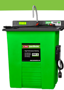
SW-25 Nettoyeur de pièces Signature