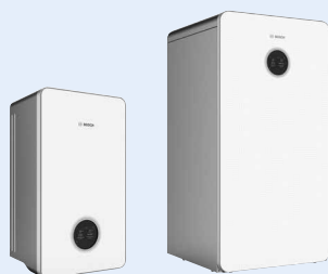
Compress 5800i AW En option avec ventilation domestique Vent 5000 C.