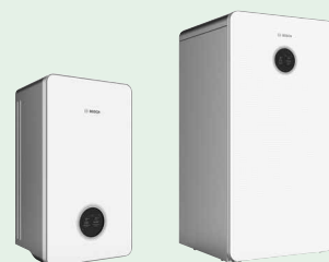
Compress 6800i AW En option avec ventilation domestique Vent 5000 C.