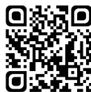
MURAO MULTI NOIR