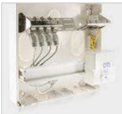
Intérieur d'un tableau 200