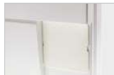
Cache obturateur plastique Réf. 4095587R13

Dans le cas d'une utilisation du TC sans DTI cuivre, nous proposons un cache obturateur en plastique.