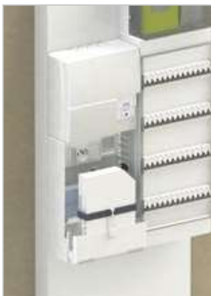
Exemple d'association avec TC 350