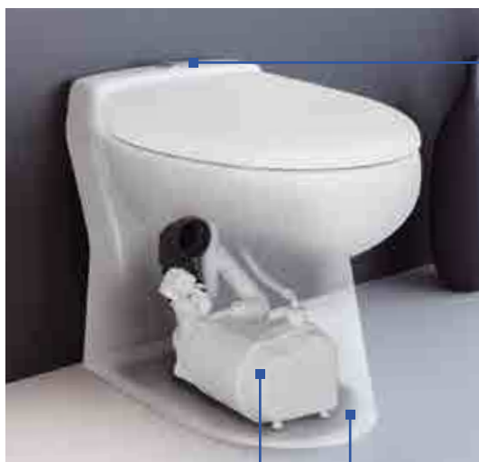
Système double touche économie d'eau 2/4 litres