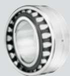
ULTAGE Roulement à rotule sur rouleaux ouvert alésage conique