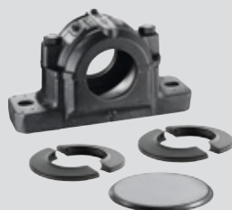
Palier à semelle SNC + 2 joints DS double lèvre + obturateur