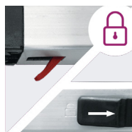
Indicateur de verrouillage

L'embase stabilisatrice est livrée non montée mais avec sa visserie et la notice de montage