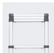
Déploiement partiel possible