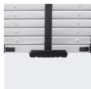
Poignée de transport