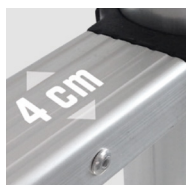
Échelons striés antidérapants