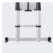
Embase avec sabots antidérapants (modèles 3,20 / 3,80 m)