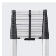
Extrême compacité (stockage et transport)