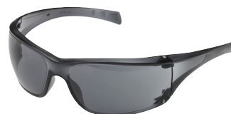
71512-00001M 3M™ Virtua™ AP (oculaires gris)