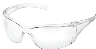
71512-00000M 3M™ Virtua™ AP (oculaires incolores)