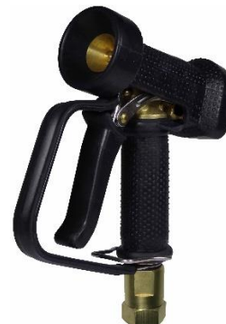
AKMBP01-BL-SWM14-3/4 Avec raccord tournant en laiton avec roulement à bille 3/4 femelle grand débit et joints plats