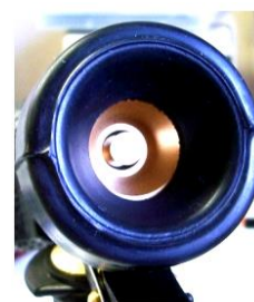
Sortis grand débit

*** Bien que tous les matériaux puissent supporter des températures supérieures à 100 °C, des précautions particulières sont recommandées lorsque de l'eau chaude est utilisée. Pas pour la vapeur !