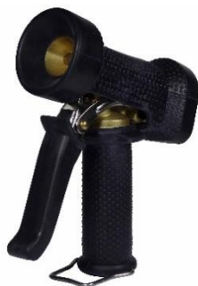
AKMB001-BL AKRB001-BL (inox 316)