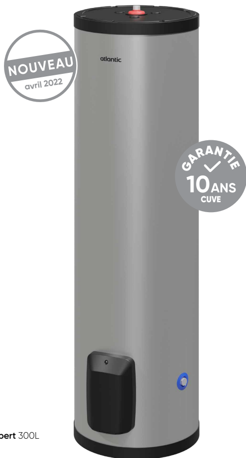
Inox Expert 300L

Robuste et durable il a été conçu pour répondre aux besoins en eau chaude sanitaire intensifs des professionnels. Inox Expert est adapté à tous les types d'eau et aux milieux difficiles.