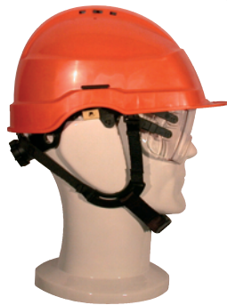
IRIS 2 MONTEUR