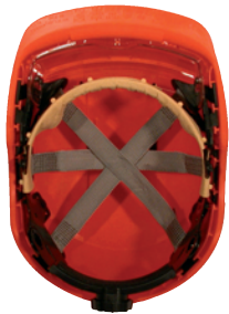
coiffe textile avec serre-nuque à crémaillère

La lunette-masque de protection, de classe optique 1 (utilisation longue durée) est prévue pour une utilisation de base et permet le port de lunettes correctrices.