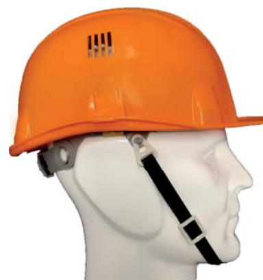
Jugulaire cuir noir 12 mm