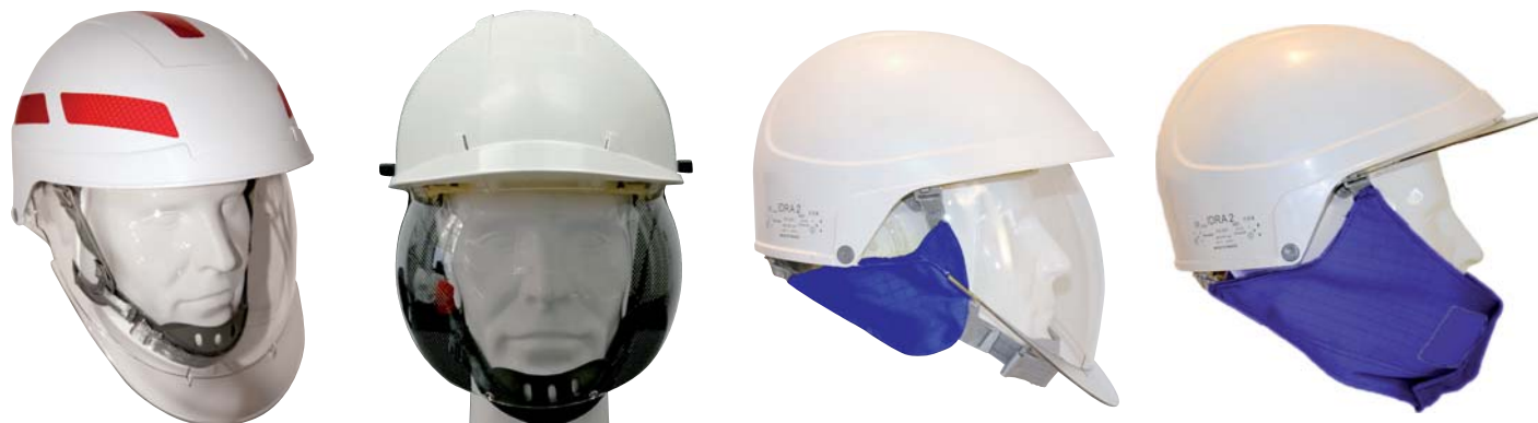
Jugulaire 4 points, grise, avec mentonnière pour casque IDRA 2