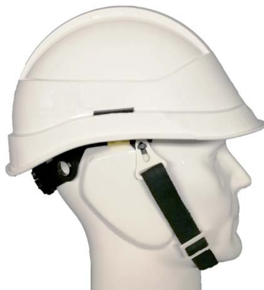
Jugulaire coton noir 20 mm

Rupture des points d'ancrage selon NF EN 397+A1 : 2013.