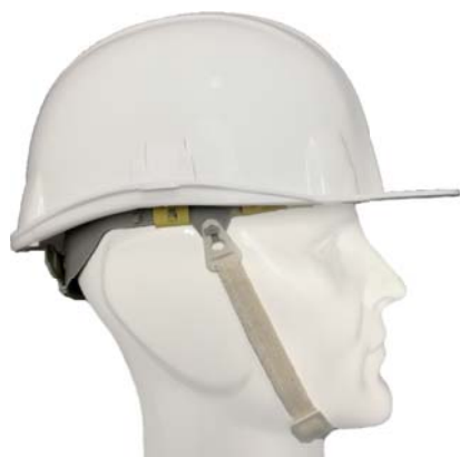
Jugulaire coton écru 12 mm