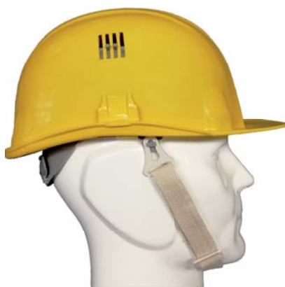
Jugulaire coton écru 20 mm