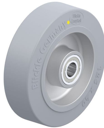
Roue utilisée ALEV 125/15K-SG-AS