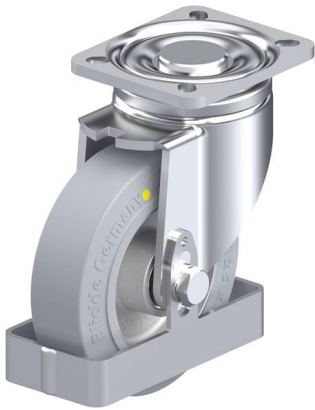
Roulette pivotante correspondante LH-ALEV 125K-1-SG-AS-FS