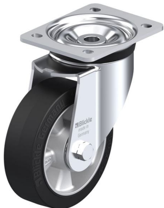
Roulette pivotante correspondante LK-ALEV 150K