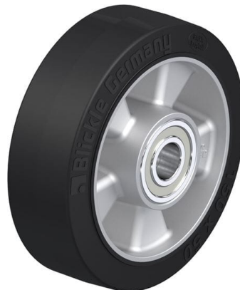
Roue utilisée ALEV 150/20K