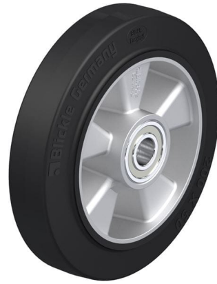
Roue utilisée ALEV 200/20K