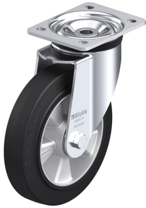
Roulette pivotante correspondante LK-ALEV 200K