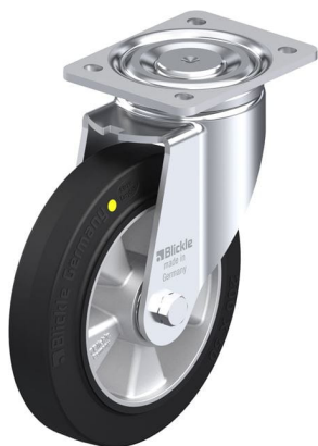
Roulette pivotante correspondante LH-ALEV 200K-EL