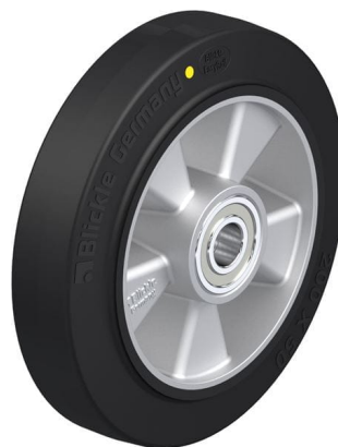
Roue utilisée ALEV 200/20K-EL