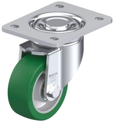
Roulette pivotante correspondante LH-ALST 100K-3