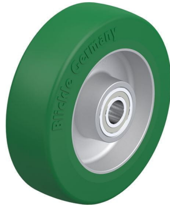
Roue utilisée ALST 125/15K