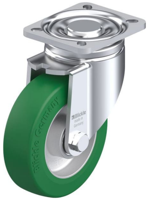
Roulette pivotante correspondante LH-ALST 125K-1