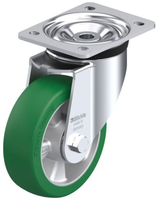
Roulette pivotante correspondante LK-ALST 150K