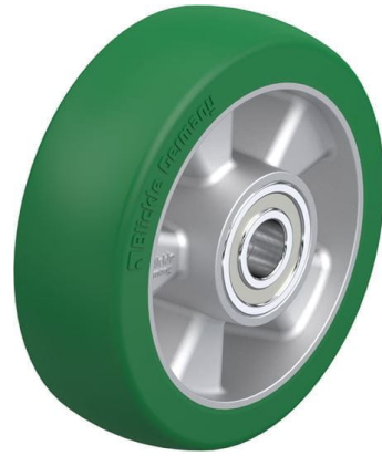
Roue utilisée ALST 150/20K