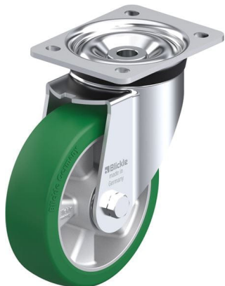
Roulette pivotante correspondante LK-ALST 160K