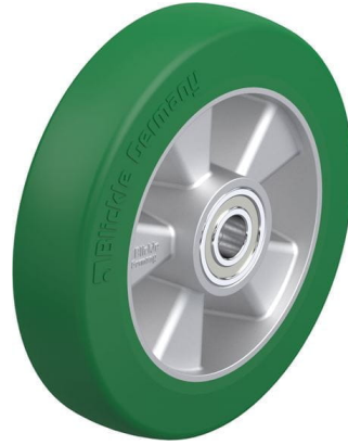
Roue utilisée ALST 200/20K