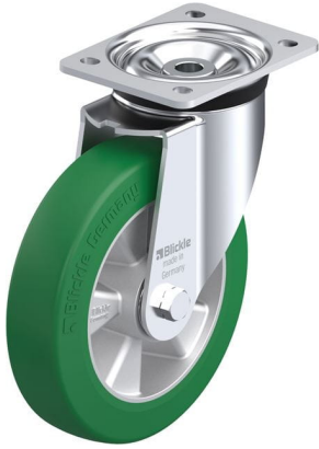
Roulette pivotante correspondante LK-ALST 200K