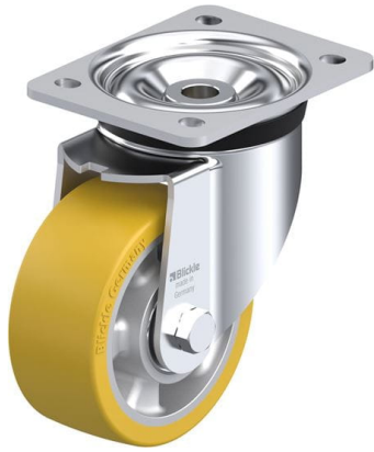
Roulette pivotante correspondante LK-ALTH 127K