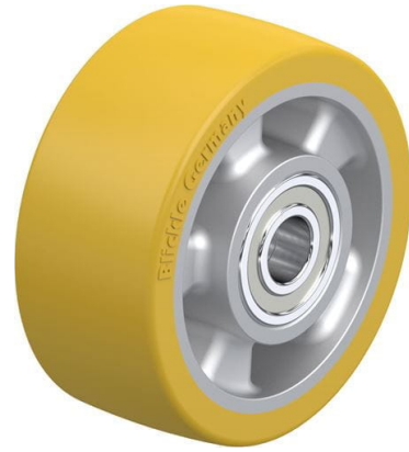
Roue utilisée ALTH 127/20K