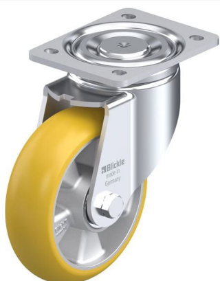
Roulette pivotante correspondante LH-ALTH 160K-CO