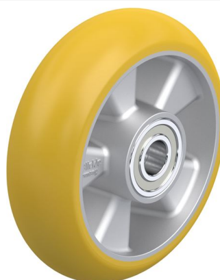
Roue utilisée ALTH 160/20K-CO