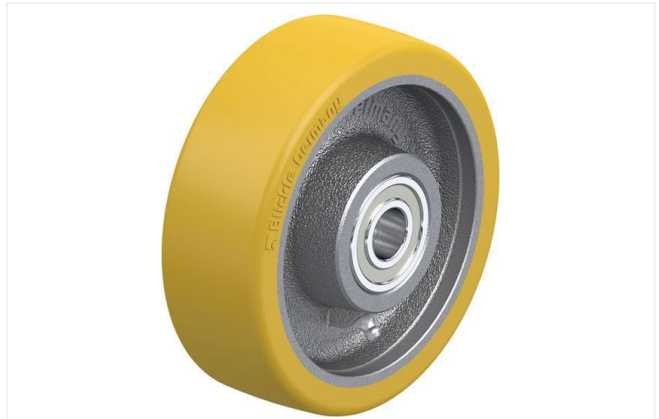
Roue utilisée GTH 150/20K