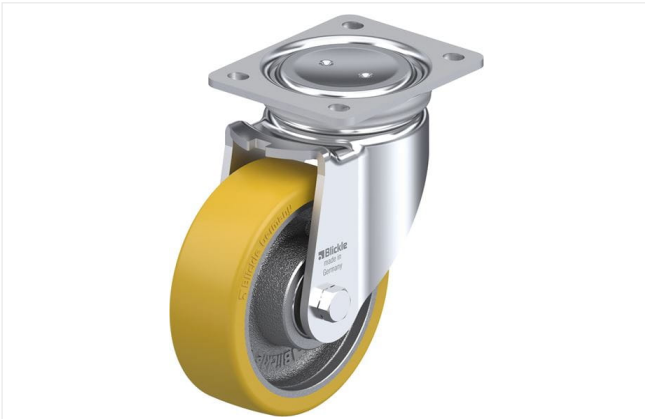
Roulette pivotante correspondante LUH-GTH 150K