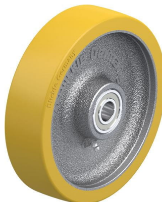
Roue utilisée GTH 200/20K