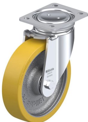
Roulette pivotante correspondante LUH-GTH 200K