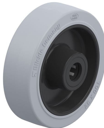
Roue utilisée POEV 100/15R-SG