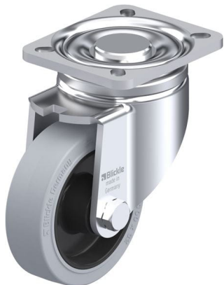
Roulette pivotante correspondante LH-POEV 100R-1-SG