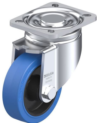
Roulette pivotante correspondante LH-POEV 100XR-1-SB