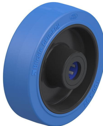
Roue utilisée POEV 100/15XR-SB