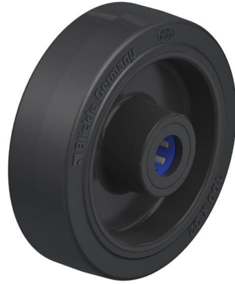
Roue utilisée POEV 100/15XR