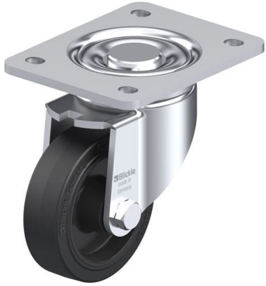
Roulette pivotante correspondante LH-POEV 100XR- 3