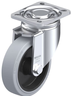
Roulette pivotante correspondante LH-POEV 125R-1-SG