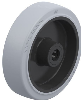
Roue utilisée POEV 125/15R-SG