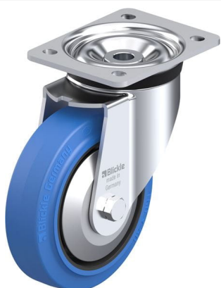
Roulette pivotante correspondante LK-POEV 160KAD-SB-FA