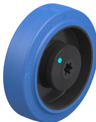
Roue utilisée POEV 160/12KAD-SB