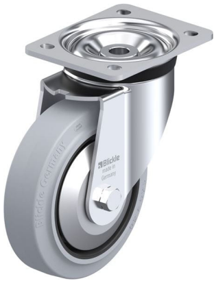
Roulette pivotante correspondante LK-POEV 160R-SG-FA