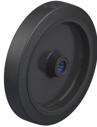
Roue utilisée POEV 250/25XR