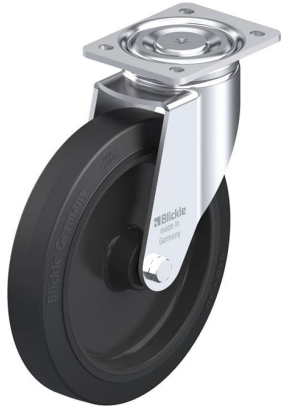
Roulette pivotante correspondante LH-POEV 250XR