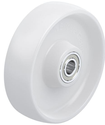
Roue utilisée PO 175/20K