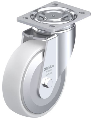
Roulette pivotante correspondante LH-PO 175K-FA