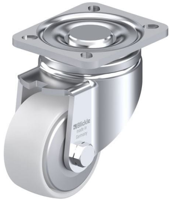
Roulette pivotante correspondante LH-PO 82K-FA