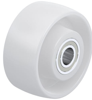
Roue utilisée PO 82/15K