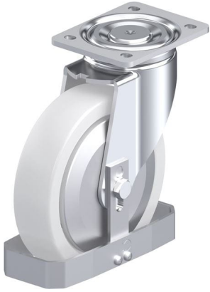
Roulette pivotante correspondante LH-SPO 200G-FA-FS