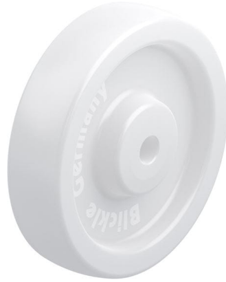
Roue utilisée SPO 200/20G