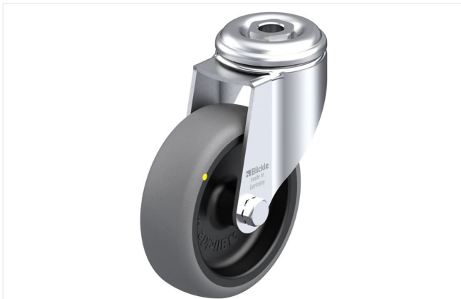
Roulette pivotante correspondante LKRA-TPA 101G-ELS