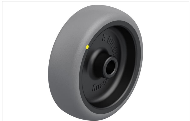
Roue utilisée TPA 101/12G-ELS