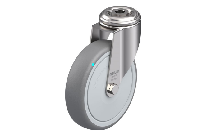
Roulette pivotante correspondante LKRXA-TPA 126KFD