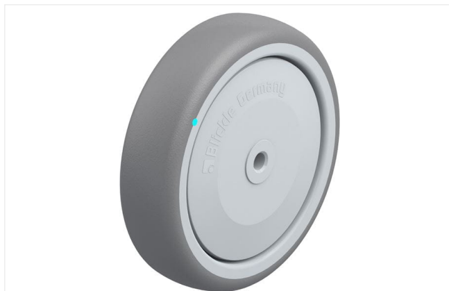
Roue utilisée TPA 126/8KFD