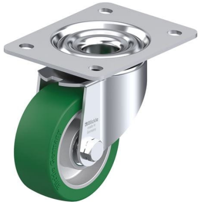
Roulette pivotante correspondante LK-ALST 100K-3