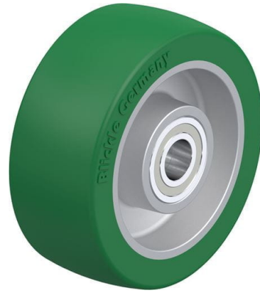
Roue utilisée ALST 100/15K